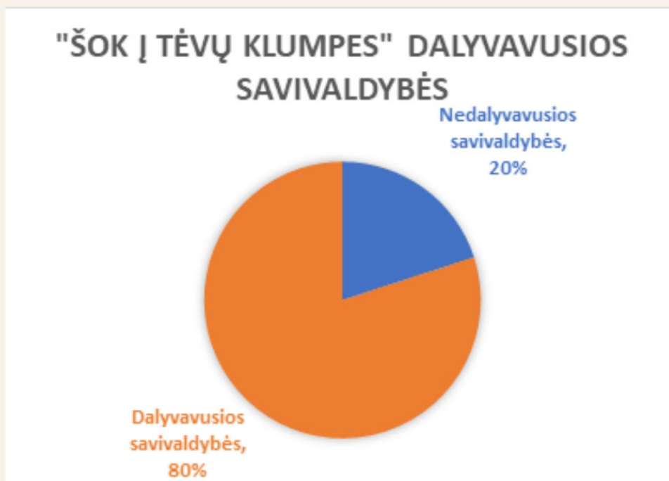
1 pav. Inicatyvoje „Šok į tėvų klumpes“ 2021 metais dalyvavusių ir nedalyvavusių savivaldybių skaičius procentais.

Nuotolinės 2021 m. iniciatyvos „Šok į tėvų klumpes“ dalyviams buvo parengtas el. klausimynas (2 priedas). Į anketos klausimus atsakė 63 mokyklos iš 158 užsiregistravusių. Rezultatų apžvalgoje duomenys yra pateikiami apibendrintai, neišskiriant atskirų bendrojo ugdymo įstaigų. Taip pat dalis duomenų pateikiama iš dalyvių registracijos www.mukis.lt internetinės svetainės. Toliau esančiuose skyreliuose yra apžvelgti šie rezultatai: įsitraukimas pagal apskritis; užsiregistravusių mokyklų tipas; įsitraukusių mokinių skaičius; profesijos, su kuriomis buvo susipažinta; įsitraukusių pedagogų skaičius; įsitraukusių tėvelių ar globėjų skaičius; iniciatyvai skirtų valandų skaičius, problemos, su kuriomis susidūrta vykdant iniciatyvą. Siekiant informatyvumo, duomenys iliustruojami diagramomis.